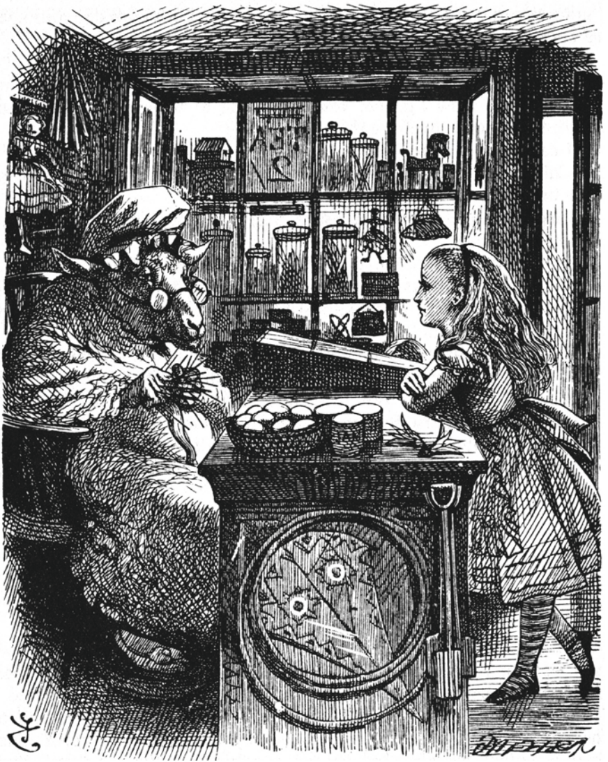
Alice im Schafsladen